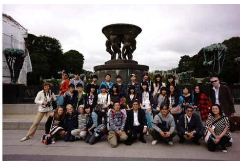
Gruppen besøker Vigelandsparken i Oslo

Gruppen var også innom Vigelandsparken i Oslo for å se Gustav Vigelands skulpturer. "Kunstslogen" ( Geijutsu no mori ) i Sapporo, et stort kultursenter hvor Sapporo Jazz School også holder til, har nemlig en spesialavtale med Oslo kommune om lån av Vigelands verker til utstilling i senteret. Vi håper at den norsk-japanske kulturutvekslingen gjennom jazzmusikken ytterligere styrker det gode vennskapet mellom våre to land.