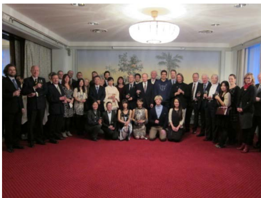
Minnefotografi sammen med gjestene